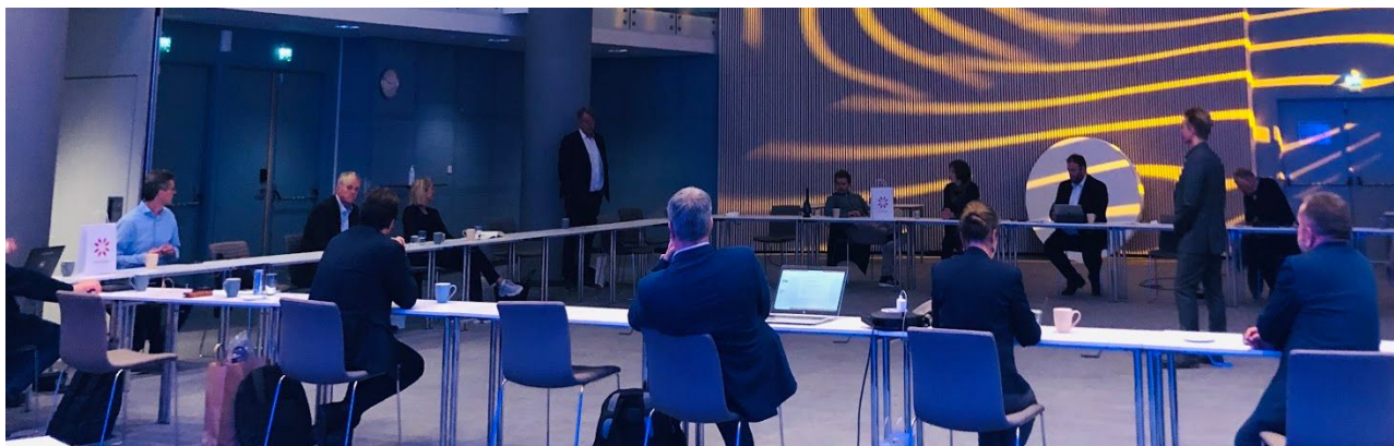
Hardangerrådet i møte med Hordalandsbenken i Bergen 28.09.2020